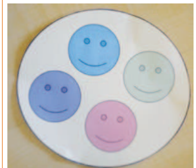
Abb. 2: Piktogramm Murmelecke, ⬇️